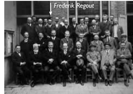
Afb. 13. Foto congres aardewerkfabrikanten 1922.