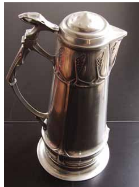
Afb. 9. Urania kan.

Bijgaande afbeeldingen tonen de omslagband van een verkoopcatalogus en een aantal voorwerpen. Gezien de signering van