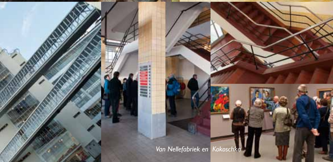
Van Nellefabriek en Kokoschka