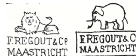
Afb. 3. Beeldmerken fabriek F. Regout.