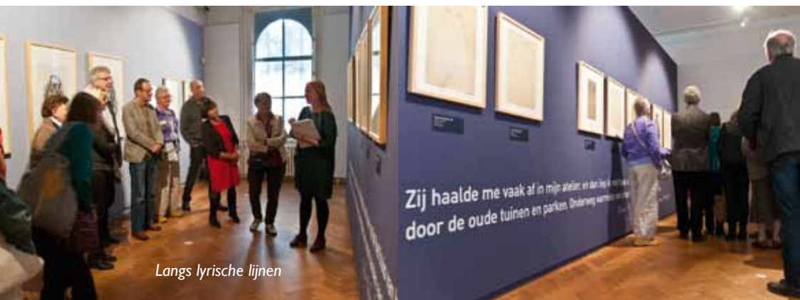
Langs lyrische lijnen