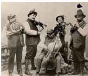
Schrammel-Quintet, 3e v.l. Arnold Schönberg

Schönberg die niet eerder in Nederland te zien waren. Zij geven een beeld van Arnold Schönberg, van zijn tijd en zijn tijdgenoten, zoals Gustav Mahler, Albert Einstein en Gabriele Münter. Natuurlijk ontbreekt werk van Kandinsky niet!