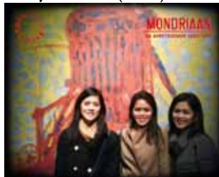
Mondriaan in Amsterdam

De expositie brengt ruim 60, veelal zelden getoonde, Mondriaans voor het eerst terug naar de stad waar ze honderd jaar geleden zijn geschilderd.