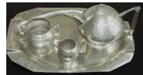
Afb. 8. Urania koffiestel.