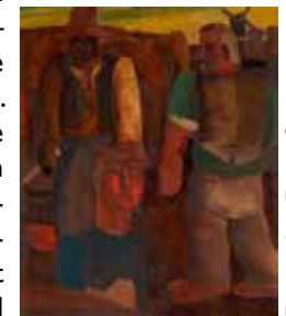
Permeke, Drie figuren.

Nooit eerder werden de Vlaamse expressionisten vanuit dit gezichtspunt gepresenteerd. De schilderijen, tekeningen en houtsnijwerken kenmerken zich door een geheel eigen stemgeluid, wars van de heersende trends in Europa. Het zijn echte gevoelsdocumenten. De hoekige, bonkige vormen van de vissers, boeren en vrouwen zijn zonder mooimakerij weergegeven. De centrale figuren binnen het Vlaamse expressionisme zijn Constant Permeke (1886 – 1952), Frits van den Berghe (1883 – 1939) en Gustave de Smet (1877 – 1943). Hoewel de Vlaamse expressionisten geen door een programma of gemeenschappelijk manifest gebonden school