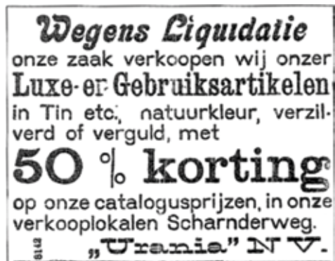
Afb. 12. Advertentie liquidatieverkoop.

Een hardnekkig misverstand is de veronderstelling dat voorwerpen gemerkt "Juventa Prima Metall" ook van de firma Urania afkomstig zouden zijn. In de Esslinger