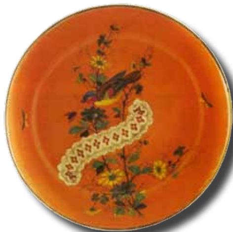
Afb. 6. Spoelkom, decor Timor. ∅ 170 mm en h = 89 mm.