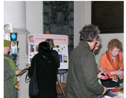
VVNK-stand op de Art Deco Beurs

Tenslotte: naar aanleiding van het verslag van de ALV op 3 november 2007 zijn geen opmerkingen binnengekomen zodat het is vastgesteld.