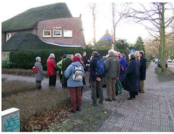
Wandeling door Park Meerwijk

(Vervolg van pagina 1) woonwijkje Park Meerwijk in Amsterdamse school - voor velen een ontdekking - uitstekend.