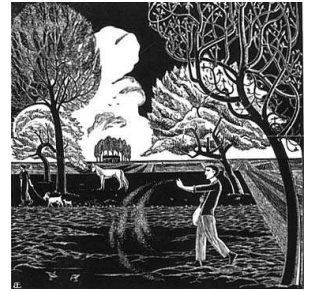
Bernard Essers, De zaaier, houtsnede, jaren '20, 33,5x33,5 cm

Op deze donderdag vindt een bezoek aan het Drents Museum plaats waar we de overzichtstentoonstelling van Bernard Essers bezoeken. Essers (1893-1945) was een bekende graficus en tekenaar die vele houtsneden en penseeltekeningen in inkt maakte. Essers is vertegenwoordigd in de SSK/museumcollectie. (Zie ook het jubileumboek van het museum 'Vernieuwing & Bezinning', pag 108) Piet Spijk houdt de inleiding. Hij is medeauteur van de monografie op basis van jarenlange studie. U kunt uw bezoek natuurlijk combineren met de tentoonstelling over het terracottaleger van Xian.