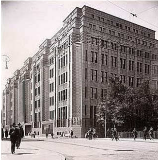
Voorheen het hoofdkantoor van de Nederlandsche Handel-Maatschappij.

Op zaterdag 19 april bezoeken we Amsterdam. Eerst worden we rondgeleid in het Stadsarchief van Amsterdam, het bekende