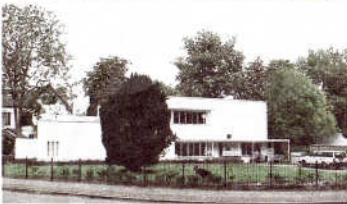
Villa aan de burgemeester Gülcherlaan.