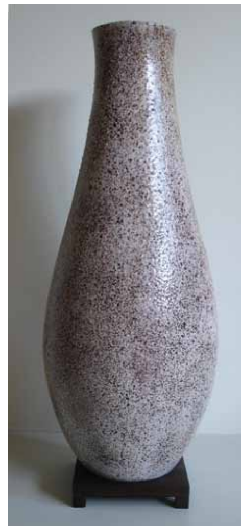
Purple Stars, aardewerk, 59,1 cm hoog, 1941-1950. Particuliere collectie.