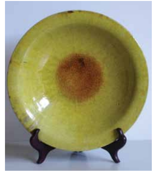
Schaal met maangelglazuur en zwart craquelé, ca 1930, 31 cm. Particuliere collectie.