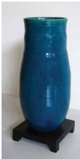
Caspian see, blauwgeglazuurde vaas, 1927, 22cm hoog. Particuliere collectie.

pottenbaksters die zelfstandig werkte als kunstpottenbakster. De Nederlandse tijdgenoten maakten vooral gebruiks aardewerk zoals koffie- en theeserviezen in effen kleuren. Het werk van Lea Halpern onderscheidt zich van haar vrouwelijke collega's. De namen die zij aan haar werkstukken geeft, verwijzen naar de natuur of de kosmos.