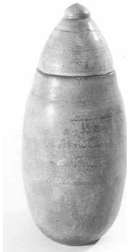
Dekselvaas, handgedraaid aardewerk, grijs craquelé, 23,5 x 11 cm, aankoop 1932. Amsterdam, Stedelijk Museum.