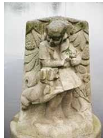
Jaap Kaas, Meisje met hond.

Jacobus (Jaap) Kaas (Amsterdam, 4 augustus 1898 - Amsterdam, 4 oktober 1972) was een Nederlands beeldhouwer, medailleur en graficus.