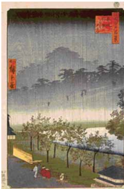
Utagawa Hiroshige, De Paulownia plantage in Akasaka in de avondregen, 1859.

Van Goghs atelierpraktijk: hergebruik van doeken; t/m juni 2012. *