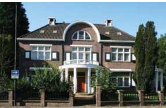
Villa Schoonoord, Regentesselaan Apeldoorn architect A.H. Wegerif.

Vergeet u niet op het pas vernieuwde Stationsplein een blik te werpen op een bijzonder kunstwerk van de hand van Giny Vos. Op de 100 meter lange 'keermuur' voor het station heeft zij met behulp van miljoenen ledlampjes een bewegend beeld geschapen, voorstellende een zandverstuiving. Ook het plein zelf bevat elementen die verwijzen naar de Veluwe, zoals de bomen en de kleur van de stenen.