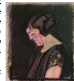
Hendrik Valk, Portret van een vrouw, 1918.

Hendrik Valk studeerde aan de Haagse Academie en ontwikkelde een eigen persoonlijke stijl die verwant is