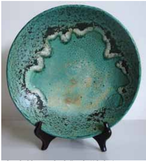
Groene schaal met schifftglazuur, ca 1930, 32 cm. Particuliere collectie.