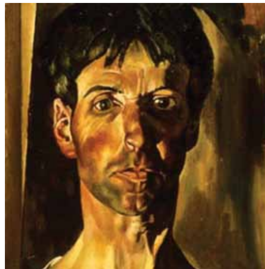
Sir Stanley Spencer.

zijn figuratieve, verhalende stijl van schilderen en zijn onderwerpkeuze heeft Spencer een belangrijke bijdrage geleverd aan de ontwikkeling van de moderne kunst. Hij verwerkt zijn turbulente leven in zijn schilderijen en voegt daar talrijke tegenstellingen en visionaire fantasieën aan toe.