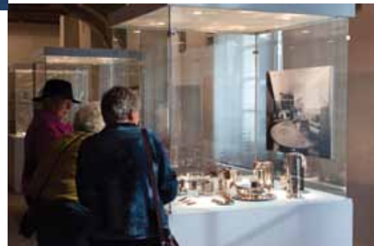
Nationaal Zilvermuseum, Schoonhoven.