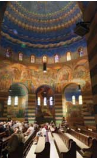
Cenakelkaerk, Heilig Land Stichting.

Berlage door Titus Eliëns, de dorpswandeling en het bezoek aan de renteniersvilla met de "meidentrap" (de dienstbode had een aparte trap van de keuken naar haar slaapkamer) was een bijzondere ervaring.